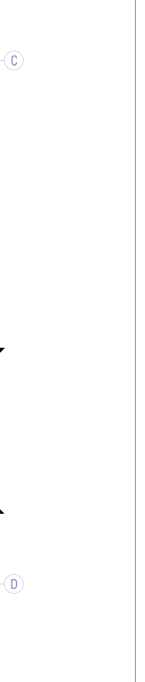
Aufbau Zwischenpodest - Feinsteinfliesen, R8, dünnbett verlegt 20 mm - Estrich, schwimmend 60 mm - Trittschalldämmung 20 mm